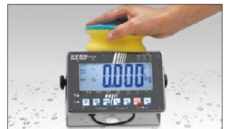
Edelstahlausführung von Auswertegerät und Plattform, dadurch rostfrei und dank glatter Flächen einfach zu reinigen