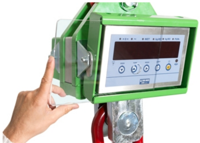
Schutzscheibe aus Plexiglas für Display und Tastatur