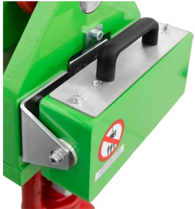
Serienmäßiges austauschbares Batteriefach