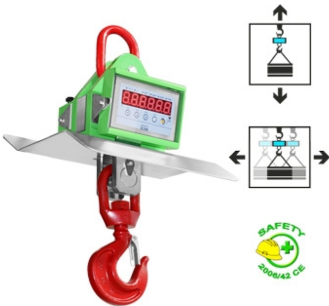
MCWHU mit optionalen Ring, Haken und Hitzeschild